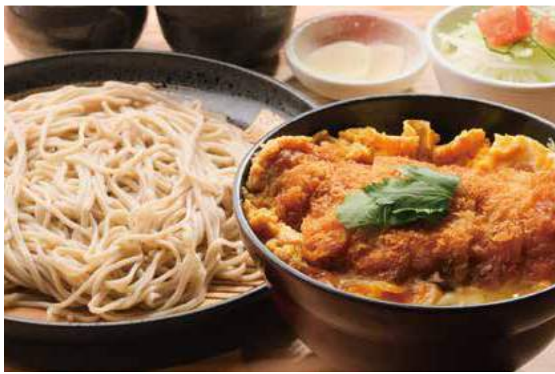
カツ丼とそばセット 並 1,450円 小 1,070円