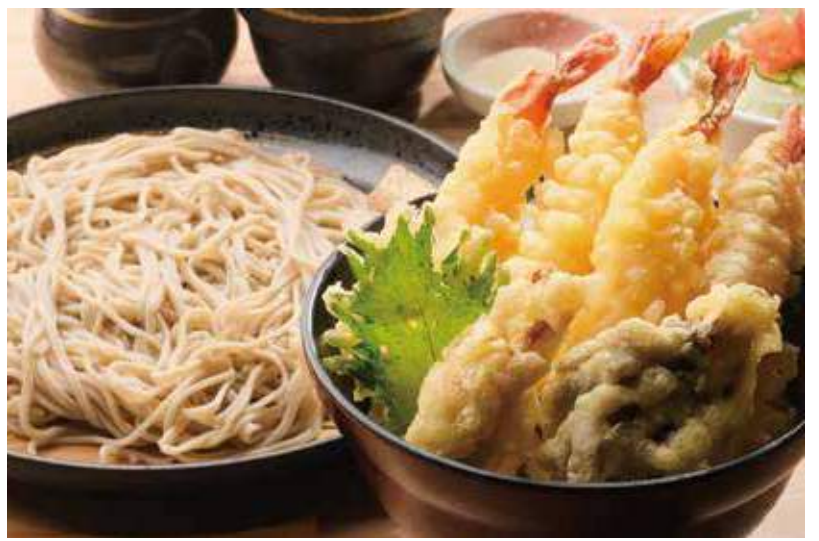
海老天丼とそばセット 並 1,480円