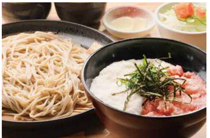
ねぎトロろ丼とそばセット 並 1,480円 小 1,080円