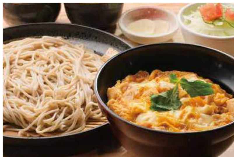
親子丼とそばセット 並 1,300円 小 1,000円